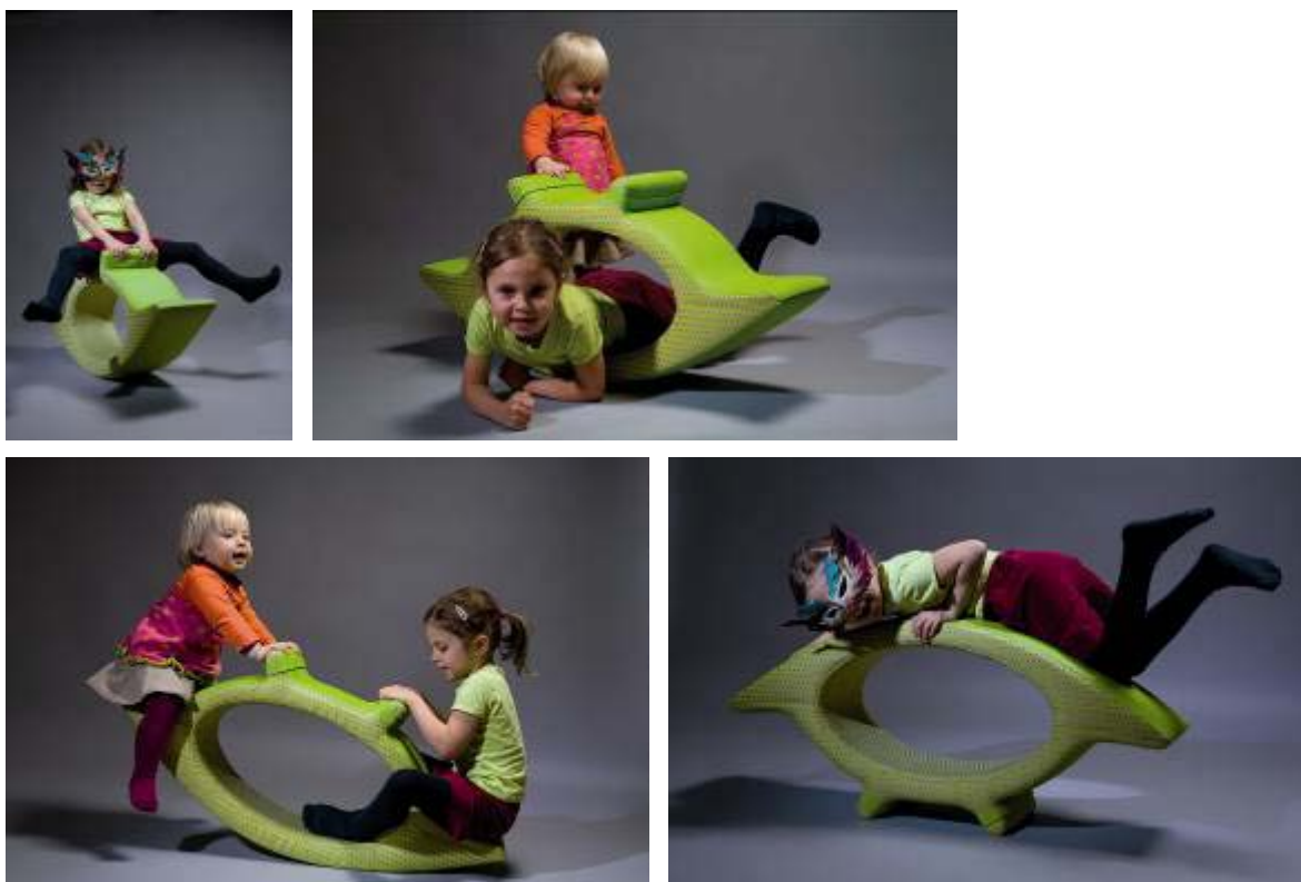
„YGO“, vítězný návrh Václava Mlynáře